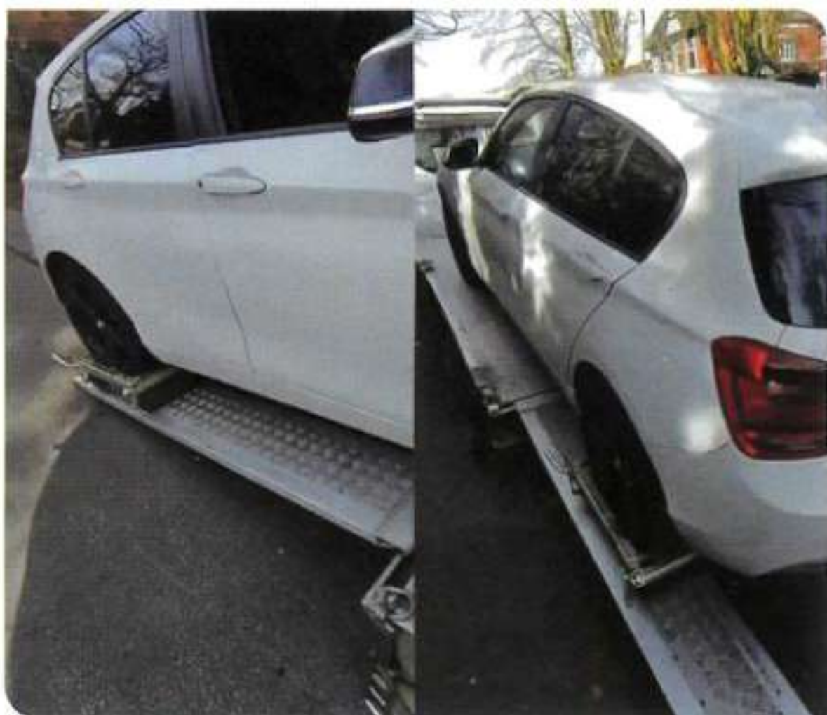
Application de remorque de dégagement d'obstacles

Techniques d'utilisation : La traverse télescopique peut être ajustée en fonction de la taille du pneu