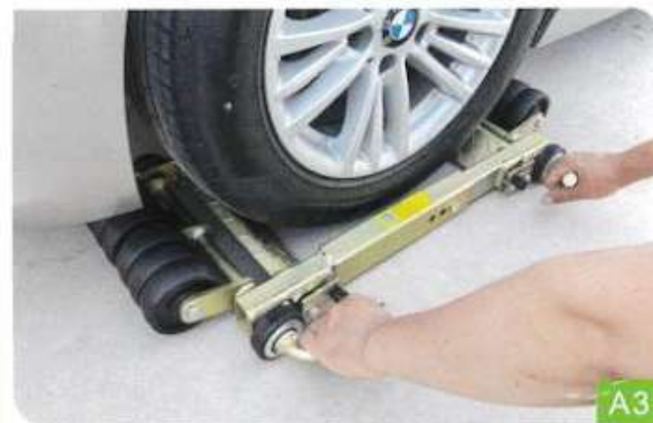
3. Poussez-la horizontalement sous les roues