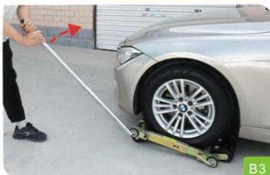
3. Retirez le pied-de-biche de l'autre côté de la même manière

Une fois les deux poignées du pied-de-biche retirées, les roues tomberont au sol.