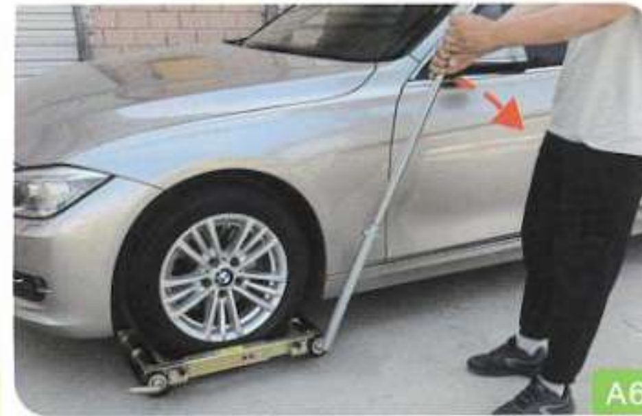
6. Soulevez la poignée de l'autre côté

Une fois les deux côtés des poignées du pied-de-biche soulevés, les roues sont levées.