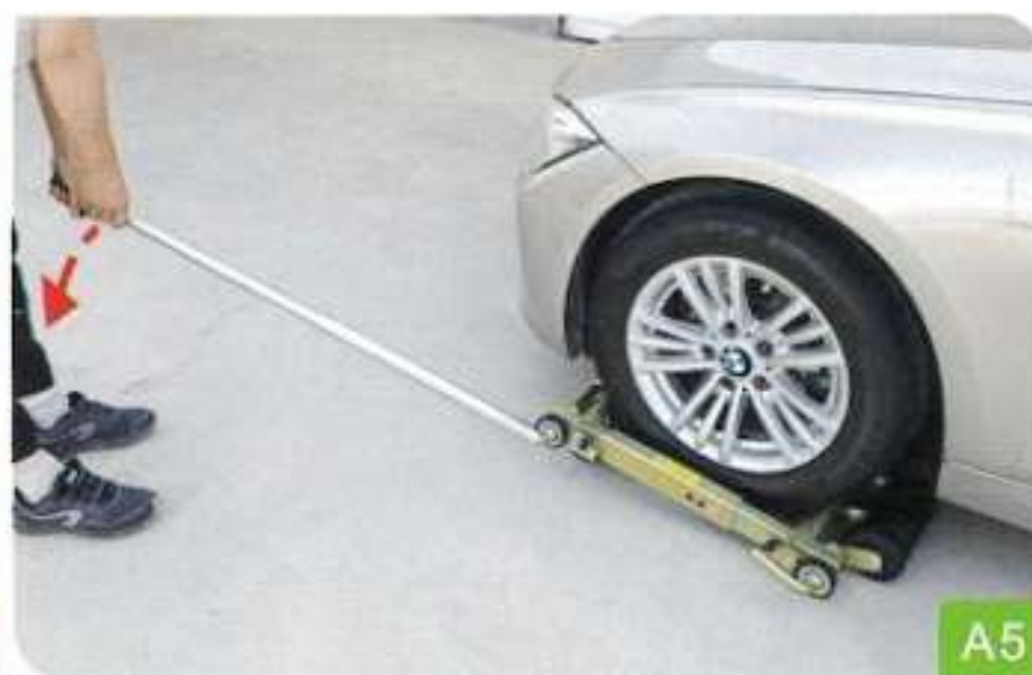
5. Soulevez un côté de la poignée du pied-de-biche