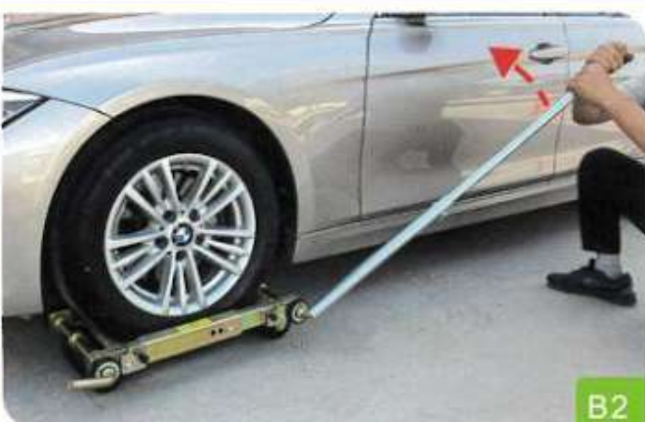
2. Retirez le pied-de-biche d'un côté