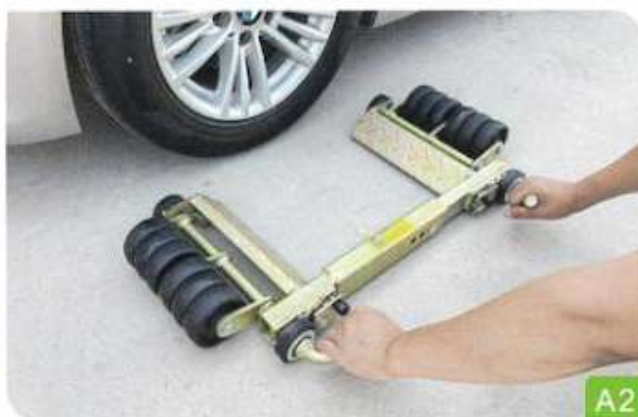
2. Déployez-la des deux côtés et posez-la à plat