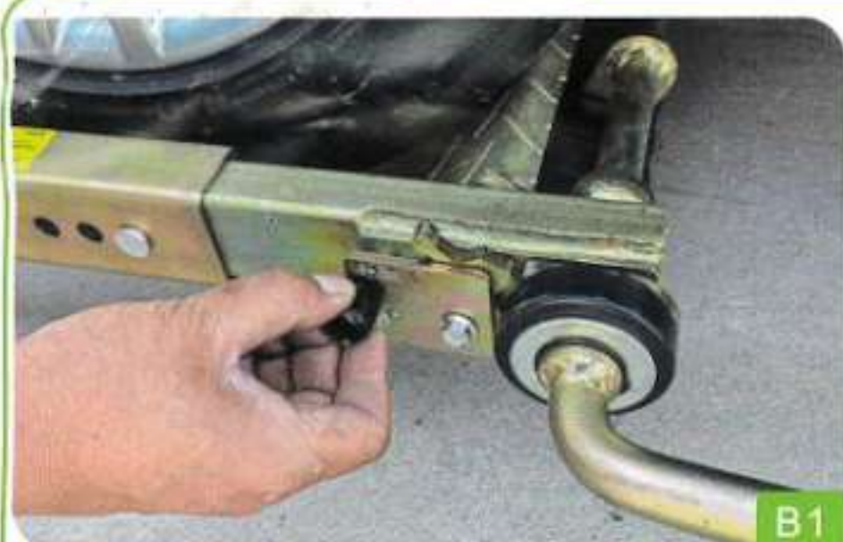
1. Tirez la poignée à ressort noire dans la fente (séparez la plaque de verrouillage)