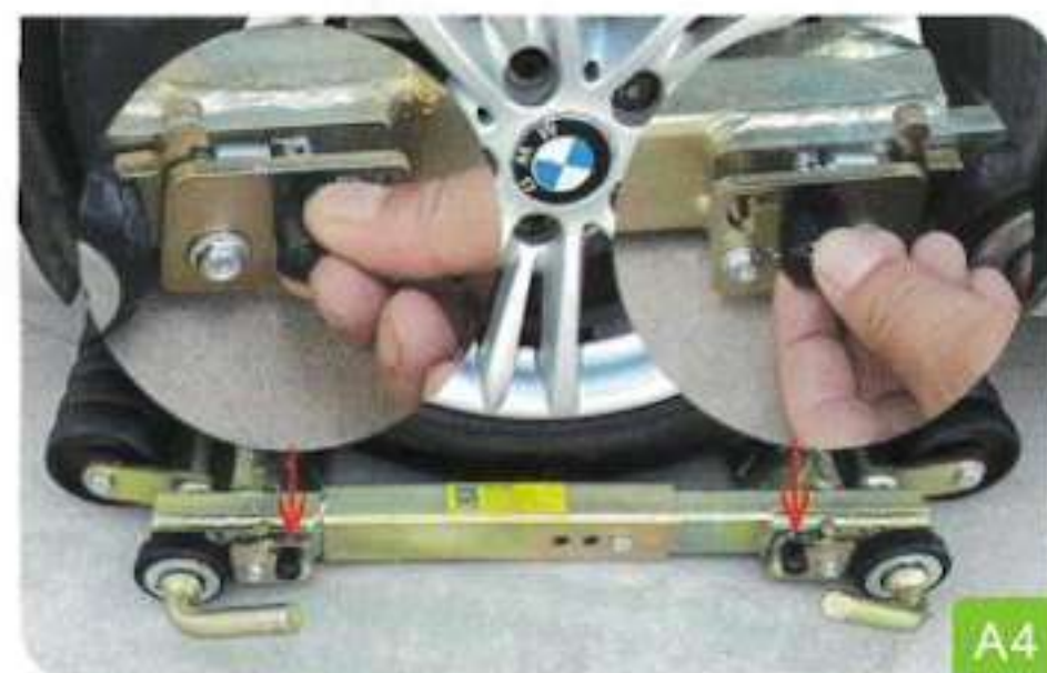
4. Réinitialisez la poignée à ressort de tension noire