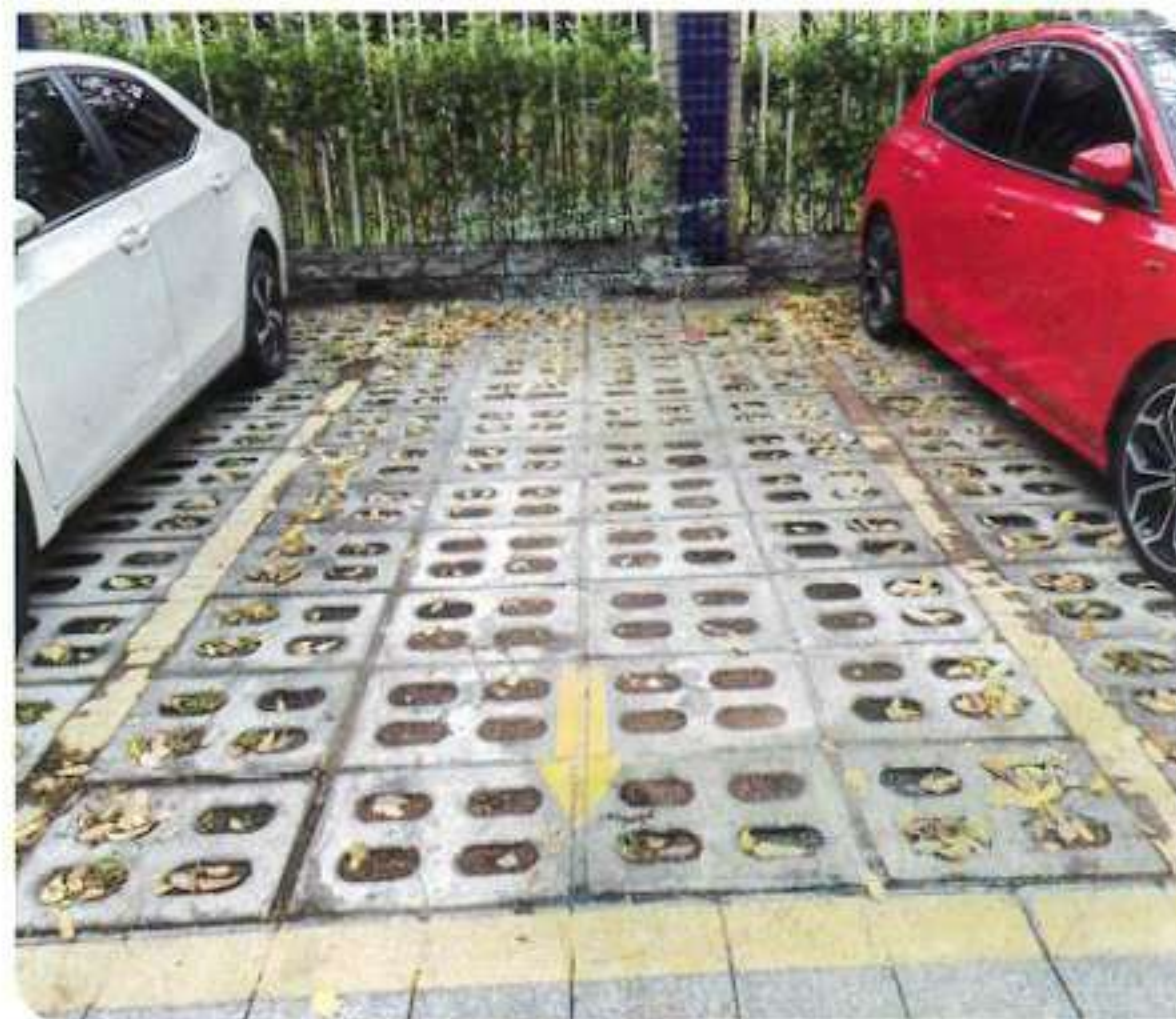
Application de dalles de pelouse perforées