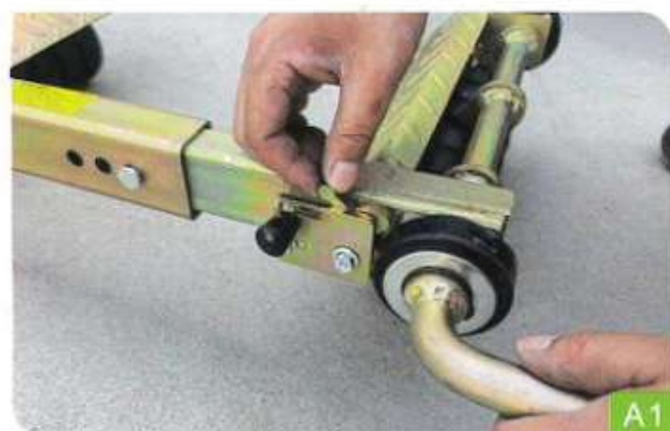
1. Ouvrez la plaque de verrouillage