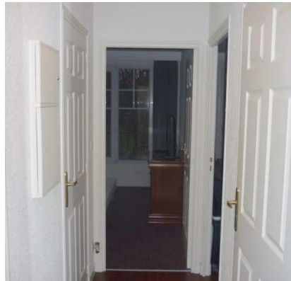
Entrée par l'Hôtel