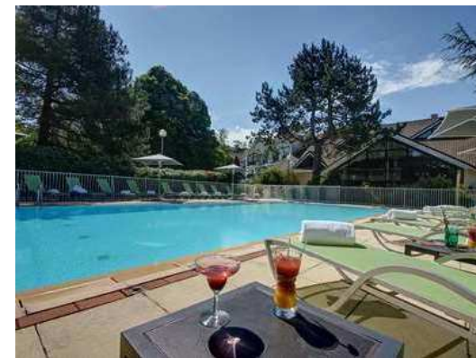
Piscine chauffée en accès libre