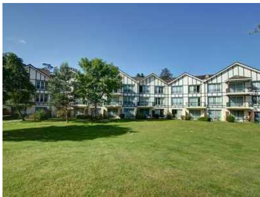
Extérieur Hôtel & Apart/Hôtel