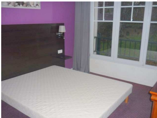
Grande Chambre sur Parc/Equipée TV