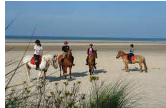
Centre d'équitation – Club Hippique – Manège / Cours/ Pension / Balades Forêt / Balades Plage