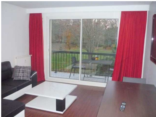
Séjour/Balcon sur parc – Vue Piscine/tennis