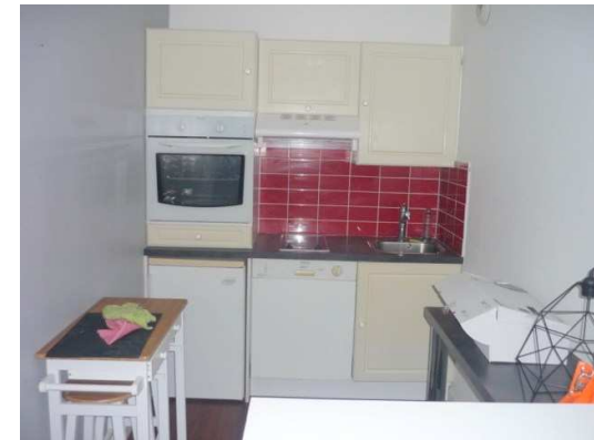
Espace cuisine aménagé et équipé sur Bar