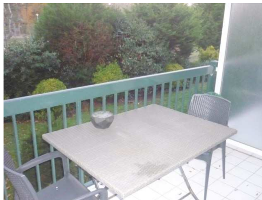
Balcon privé sur parc