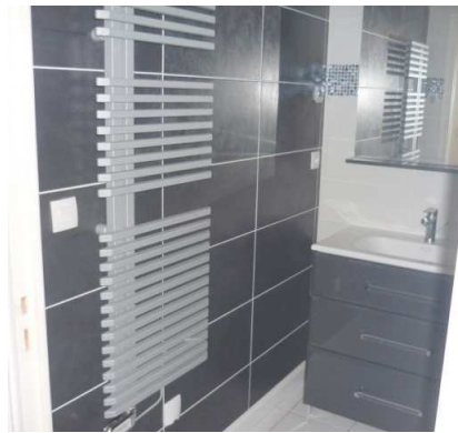
Belle salle d'eau – Douche à l'italienne