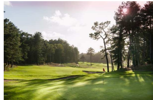
Golf des Pins – 18 trous - restaurant