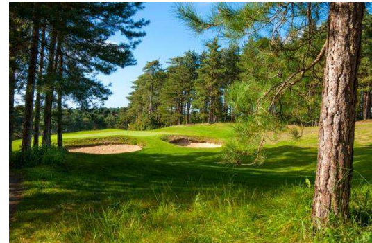
Golf des Dunes – 18 trous - restaurant