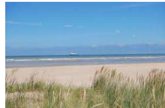
Immense plage, restaurants en front de mer...Clubs nautiques (Speed Sail/Char à voile)