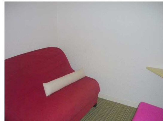
Petite chambre – BZ 2 personnes