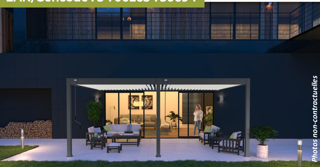
Pergola Bioclimatique Ombrea VS 4x6M adossée – Anthracite (Version 2)