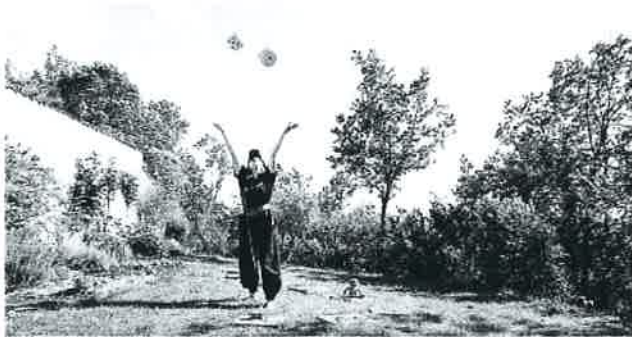
De nombreuses animations et jeux vous attendront autour du lac.