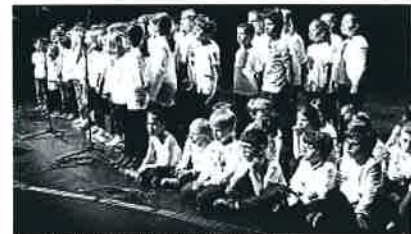
Les petits chanteurs de l'école élémentaire.

Pour le deuxième volet de la fête des écoles, l'Astarac allierait encore complet samedi après-midi. L'occasion d'écouter au terme de leur 1 er ou 2 e année les élèves de CM1 et CM2 ayant bénéficié au sein de l'école d'une première initiation musicale avec découverte des instruments. Des résultats étonnants qui leur permettront, dès l'entrée en 6 e , de poursuivre leur apprentissage. La démonstration faite la veille sur la même scène par les collégiens constitue un encouragement : on a, semble-t-il, parlé de « soirée magique ». En deuxième partie, place tut l'assée aux petits chanteurs des C.P., C.E., C.M. réunis en chorale pour interpréter joliment des chansons à succès.