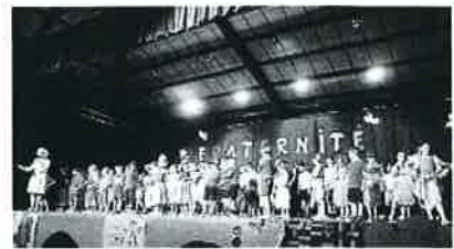
Quel magnifique spectacle sur le thème de la fraternité.

Le vendredi 30 juin, les élèves de l'école Notre-Dame de Mirande et les enfants du Jardin des Coccinelles ont présenté leur spectacle de fin d'année. C'est dans la salle André-Beaudran que la représentation s'est déroulée avec pour thème « La fraternité au travers des continents ». Les élèves de maternelle nous ont fait voyager en Asie et en Afrique. Quant aux classes de primaire, ils nous ont donné rendez-vous en Océanie, en Amérique latine et en Europe. Les enfants avaient des costumes très colorés : paréos, pagnes, tenues de sport, sombreros, etc. Les spectateurs sont repartis enchantés et prêts à revenir l'année prochaine.