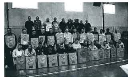
Le vrai bouclier est exposé au stade pour l'an, et une copie a été offerte à chaque joueur et dirigeant

Si la journée « Tout Jeu-Tout Flamme », avec un vide grenier et un concours de pétanque sur la place du toirad, organisée par l'amicale des sapeurs-pompiers a été quelque peu gâchée par le temps, la soirée conviviale au gymnase restera un bon souvenir pour les nombreux participants venus déguster le repas.