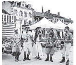
Un ensemble à la fois pittoresque et bien agréable à écouter.

Prochains marchés musicaux (sur la place de Marcillac puis au bord du lac) les 19 et 26 juillet, 16 et 23 août.