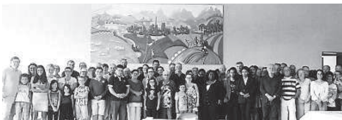
Les Lalannais réunis à l'occasion de la Fête nationale.