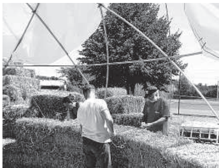
Les bâtisseurs sont à l'œuvre, l'igloo prend forme.

Un grand merci aux nombreux bénévoles qui travaillent sans relâche sous la chaleur pour monter une à une toutes ces bottes de paille, les ficeler, les tailler, etc. Ce futur igloo pourra accueillir diverses manifestations telles que des concerts, du théâtre, des conteurs, des ateliers de dessin et bien d'autres choses encore. Une fabuleuse sonorité produite par la structure en paille ravira