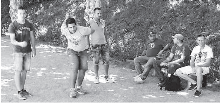
L'ombre des allées Charles-de-Gaulle est très appréciée des joueurs et des spectateurs