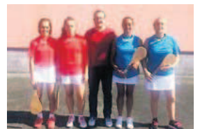
Nouveau titre pour la paire massylvaine.

Les pelotaris massylvains s'exportent chaque année sur les tournois des Hautes-Pyrénées, avec des fortunes diverses. Dernièrement, une équipe féminine s'est illustrée au tournoi en place libre de Lafitte.