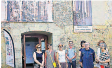
Des visiteurs particulièrement intéressés par le sujet.

Avant même de passer sous le porche qui donne accès à la cour de l'ancien couvent des Augustins, place du Chevalier-d'Antras, les visiteurs découvrent sur le mur de grandes images représentant précisément des éléments de ce beau monument, vendus en 1906, démontés et expédiés pour une destination inconnue. Le suspense aura duré 106 ans ! Ce fut une immense joie pour les Marciacais, plus encore pour les autorités communales lorsque, au mois de mars 2016, la découverte sur Internet de l'annonce de la mise aux enchères, aux États-Unis, par l'agence « Christie's », de mobilier provenant de « the Abbey of Marciac, Gers, France » se révéla