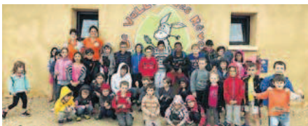
Les enfants ont aimé « le Vallon des rêves ».

Le centre de loisirs d'Astarac-Arros en Gascogne a fait le plein d'activités et de découvertes lors de ce premier mois de vacances. Sur ces 3 semaines, les enfants ont voyagé en Amérique, en Asie et en Afrique via des activités coopératives, culinaires et culturelles. Ils ont aussi testé les pouvoirs des superhéros comme Wolverine et se sont envolés sur l'eau à Ludina et à Castéra-Verduran à l'aide de gigantesques toboggans. Leurs pas les ont ensuite guidés vers le « Vallon des rêves » à Labéjan, pour terminer en beauté, avec une visite