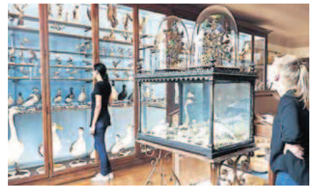
Les vitrines du Musée d'histoire naturelle.