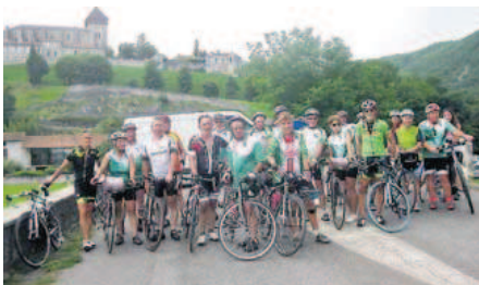
Au pied de la cathédrale à Saint-Bertrand-de-Comminges.

L'après-Rosas. Après le séjour à Rosas, les cyclos sont repartis sur les routes et les randonnées des clubs se sont succédés : Monferran-Savès, Valentine, Rabastens, Saint-Nicolas-de-la-Grave, Betplan, Loudenvielle (souvenir Michel-Barrière) et Labastide-Paumès. A l'île d'Ager. La réunion mensuelle a eu lieu autour d'un repas grillades pour se retrouver, faire le point et récupérer. Ce fut un temps toujours très convivial. Deux sorties. Le 22, une sortie a eu lieu à Loudenvielle pour le souvenir Michel-Barrière avec le comité départemental (Codedep) de cyclotourisme. Ils