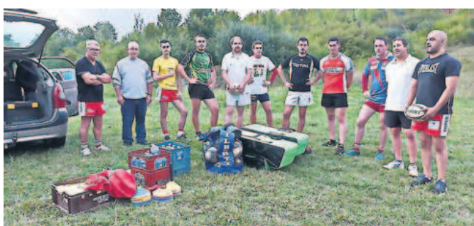
Premier galop d'essai sur le terrain d'entraînement.

Le 15 août marque souvent un tournant dans les vacances d'été. Il faut penser à la rentrée et, dans cette période, il y a souvent des orages dit « les orages du 15 août ». Cette année, l'orage a été en avance. Il a éclaté vers 23 h 30, au moment où les Mirandais se déplaçaient pour se rendre devant ce qui sera la future maison de santé afin d'assister au mapping, projection d'image sur des murs. L'orage et la pluie ont cessé quasiment à minuit et la projection a pu avoir lieu. Une projection qui a séduit le public.