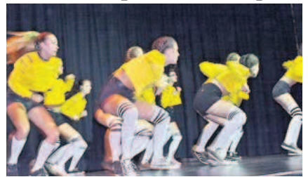
C'est bientôt la rentrée pour Arabesque.

C'est la rentrée pour Arabesque, avec Daisy et Brissy. Les cours reprendront à partir du mardi 12 septembre, à 17 h 15, avec Brissy, et à partir du vendredi 15 septembre, à 17 heures, avec Daisy. Avec Daisy. Le vendredi, rock, salsa, danse à 2... de 17 heures à 18 heures (enfants I), de 18 heures à 19 heures (enfants II) et de 19 heures à 20 heures (adolescents). Le samedi, de 10 heures à 10 h 45, initiation à la danse (à partir de 6 ans) et de 10 h 45 à 11 h 30, éveil à la danse (à partir de 4 ans). Renseignements au