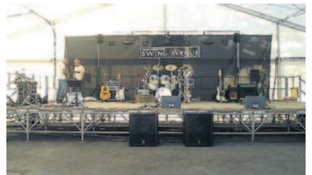
Le bal sera animé par l'orchestre Swing Avenue.

Estampes-Castelfranc sera en fête du 1 er au 3 septembre. Vendredi 1 er septembre. A partir de 19 h 30, apéritif animé par les chanteurs du groupe Can't d'Astarac. Puis suivra le repas (adultes, 12 €; enfants de plus de 4 ans, 8 €; inscriptions avant le 24 août auprès de Lucile, au 06.85.97.43.33). Samedi 2 septembre. Vide-greniers avec structure gonflable pour les enfants (à 7 heures, accueil des exposants avec un café offert, 2 € le mètre, 5 € les 3 mètres; buvette et sandwiches sur place; renseigne-