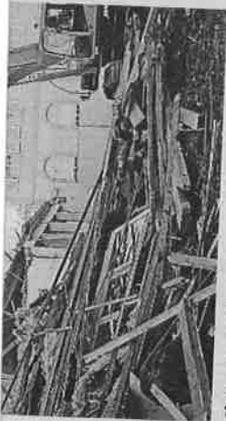
C'est avec un brin de nostalgie que les plus anciens résidents assistent à la démolition de leur lieu de vie.