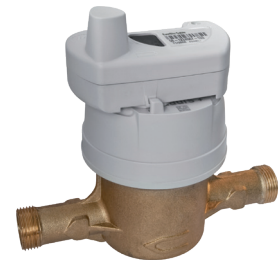
Compteur d'eau Aquadis+ équipé du module Everblu Cyble Enhanced