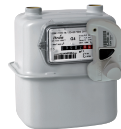
Compteur de gaz Gallus équipé du module Everblu Cyble Enhanced

Le module compact Everblu Cyble Enhanced, grâce à la technologie Cible brevetée, transmet parfaitement l'index mécanique du compteur d'eau (prise en compte des éventuels retours d'eau). Il filtre toute impulsion parasite générée, par exemple, par la vibration d'une canalisation.