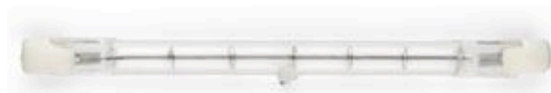
Tube halogène linéaire de 117 mm de 100 à 500 watts